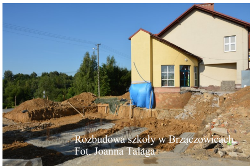
Rozbudowa szkoły w Brzączowicach.

Kiedy z ostatnimi dniami czerwca szkoły żegnają uczniów, nie oznacza to, że świecą one pustkami przez następne dwa miesiące. Wakacje to dogodny czas na remonty i modernizację placówek oświatowych. Nie inaczej było w tym roku w naszej