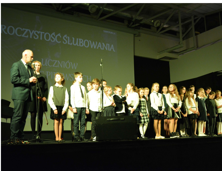
Szkoła Muzyczna w Dobczycach