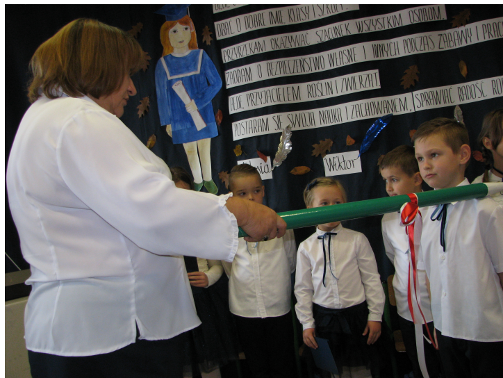
Szkoła Podstawowa Nowa Wieś