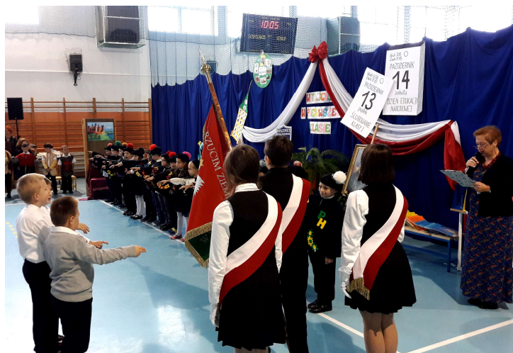
Szkoła Podstawowa Brzączowice