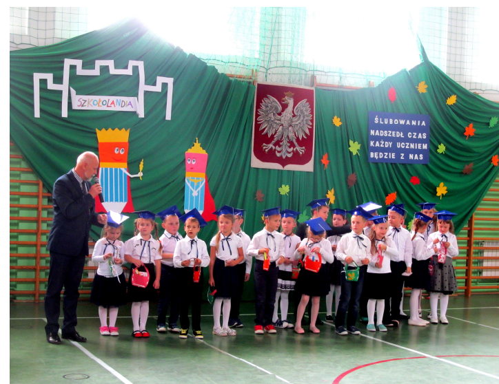
Szkoła Podstawowa Stadniki