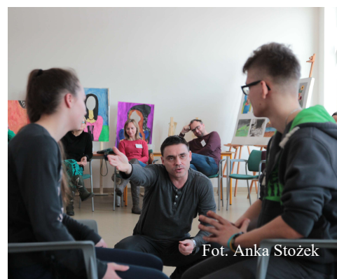
Fot. Anka Stożek