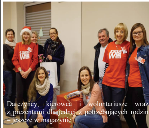
Darczyńcy, kierowca i wolontariusze wraz z prezentami dla jednej z potrzebujących rodzin – jeszcze w magazynie

Dobiegła końca IV edycja Szlachetnej Paczki w rejonie Dobczyc. Łącznie pomoc w tym roku otrzymało 36. rodzin z gmin: Dobczyce, Wiśniowa i Raciechowice. Ostania Rodzina została wybrana 11 grudnia, na nie-