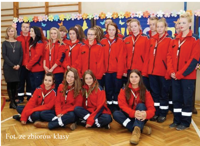
Fot. ze zbiorów klasy

W tym roku szkolnym Zespół Szkół w Dobzycach uruchomił nowy profil LO - Liceum Ratownicze. To klasa, która realizuje rozszerzony program nauczania z biologii i języka angielskiego, a dodatkowym