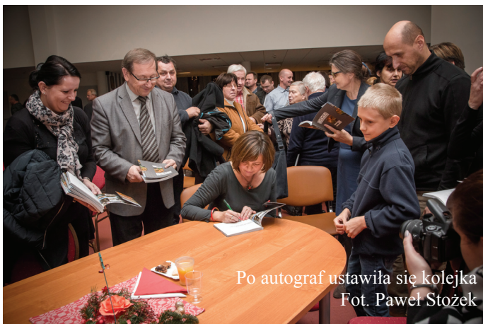
Po autograf ustawila się kolejka