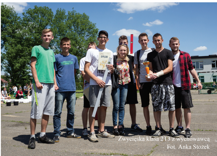
Zwycięska klasa 2T3 z wychowawcą

Strong Builder – pod takim hasłem w Zespole Szkół zorganizowane zostały pierwsze zawody klas budowlanych. Konkurencje dla swoich uczniów przygotowali nauczyciele klas budowlanych. Świetna zabawa, jaka towarzyszyła tej szkolnej imprezie zapo-