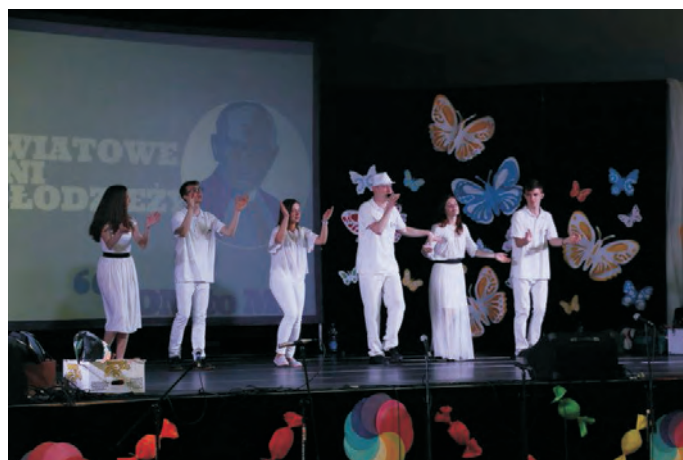
Zakończenie akcji "Zostań Super Czytelnikiem"