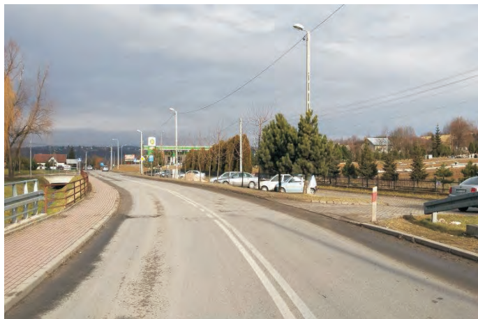
Oświetlenie - Dobczyce ulica Obwodowa