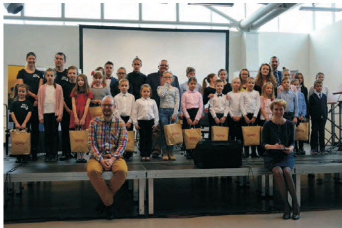
Gala Klubu Sportowego "Raba Dobczyce"