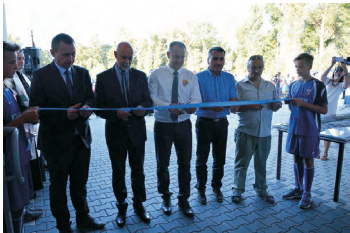
Otwarcie budynku Klubu Sportowego "Raba Dobczyce"