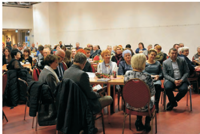
Targi książki w Stadnikach