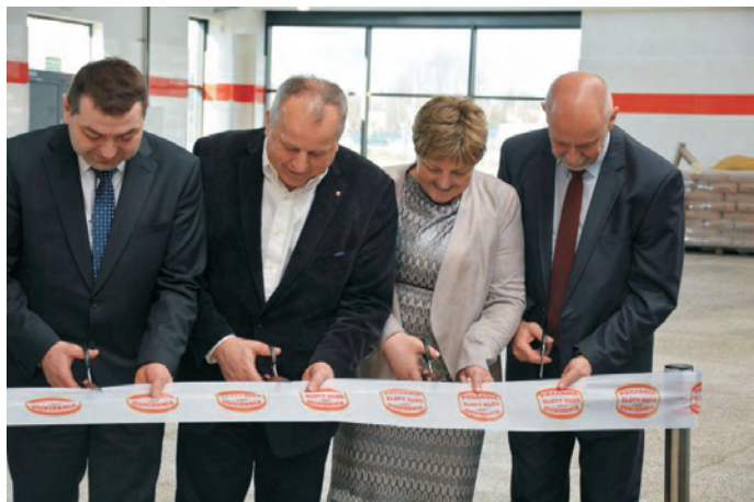
Otwarcie nowego zakładu piekarni "Złoty Kłos"