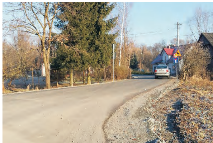
Modernizacja drogi w Skrzynce