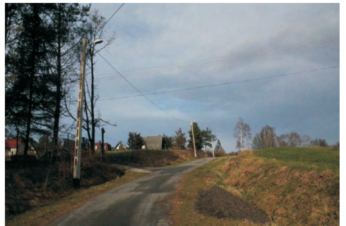
Oświetlenie uliczne w Brzezowej