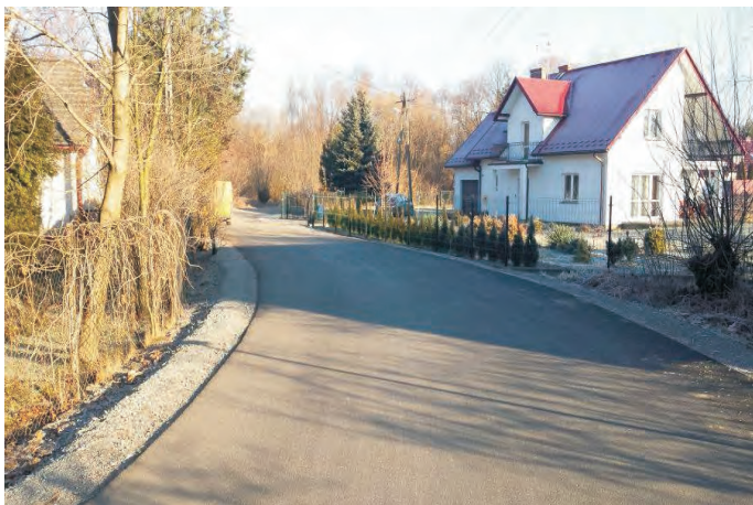
Modernizacja drogi w Niezdowie