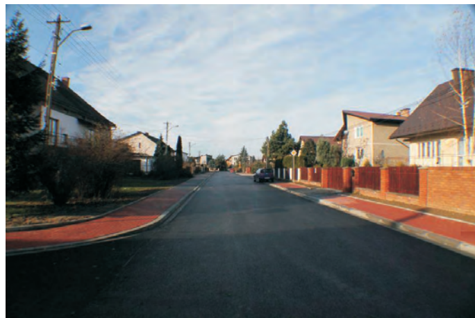
Modernizacja drogi Brzączowice-Podlesie