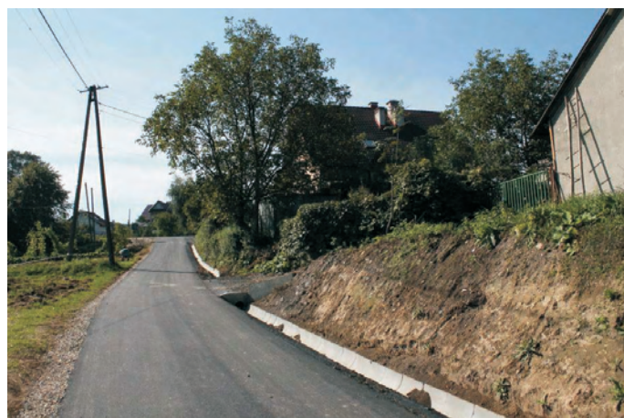
Modernizacja drogi w Kędzierzynie