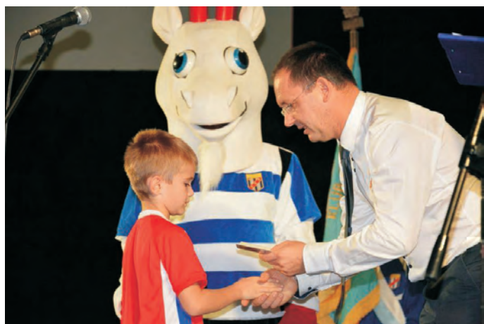
Piłkarska Eskorta Klubu Kulturalnego Kibica