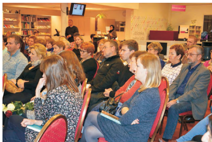
Obchody Święta Niepodległości oraz odsłonięcie makiety historycznej