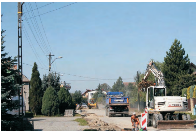
Modernizacja ulicy Słonecznej