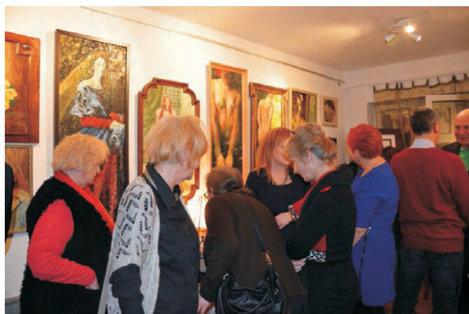
Dzień Kobiet w Gminie Dobczyce