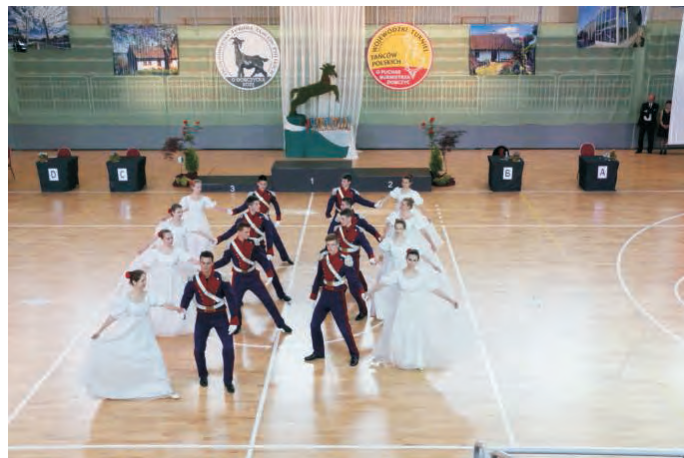
XXI Dni Dobczyc