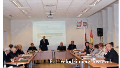
Fot. Włodzimierz Juszcak

- Projekty dotyczące turystyki będą sprzyjać rozwojowi gospodarstwu, ale będą też służyć bezpośrednio naszym mieszkańcom – podsu-