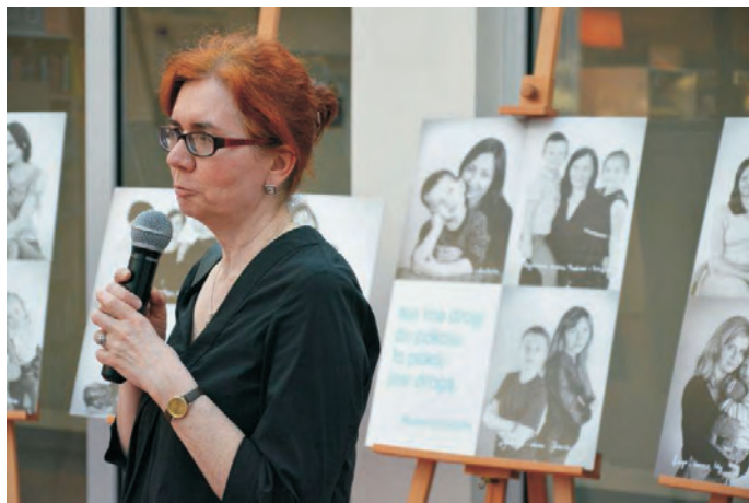
Wernisaż Wystawy "Jestem matką, daję życie"