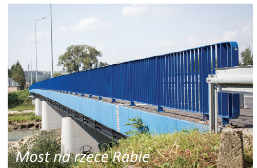
Most na rzece Rabie