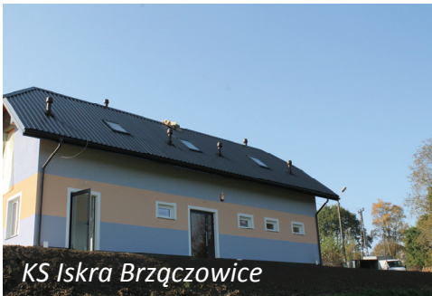
KS Iskra Brzączowice