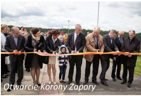
Otwarcie Korony Zapory