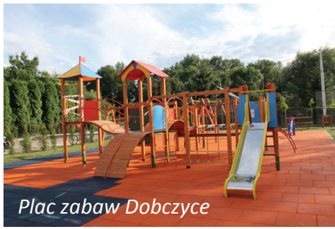
Plac zabaw Dobczyce