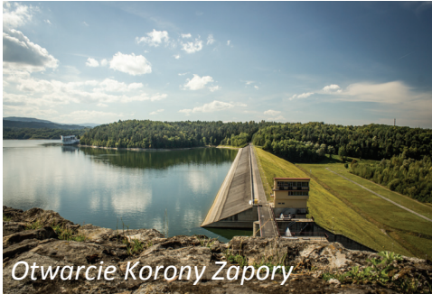
Otwarcie Korony Zapory