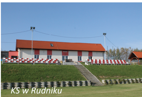
KS w Rudniku