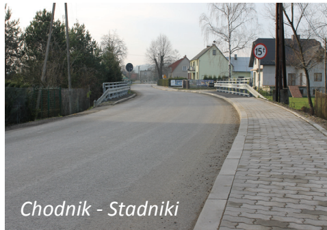
Chodnik - Stadniki