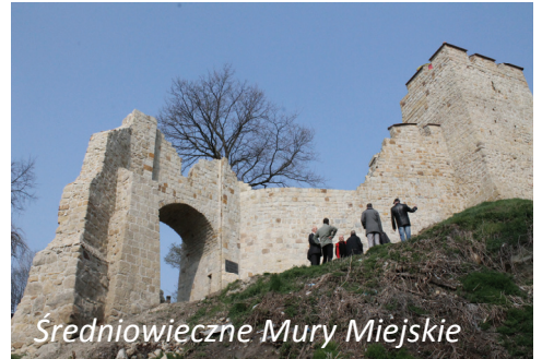
Średniowieczne Mury Miejskie