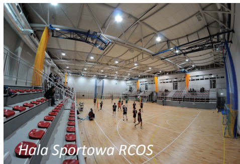
Hala Sportowa RCOS