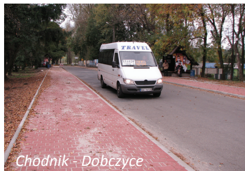
Chodnik - Dobczyce