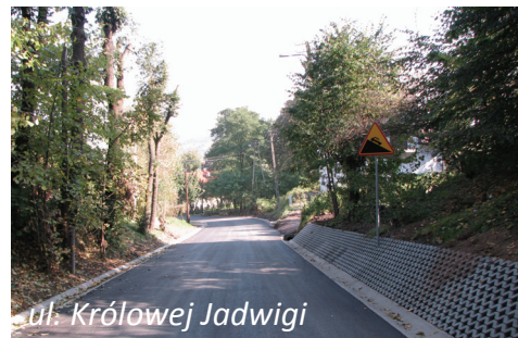
ul. Królowej Jadwigi