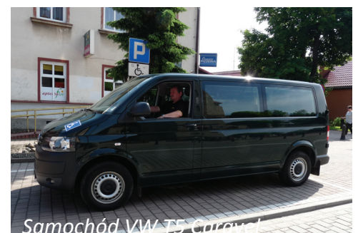
Samochód VW T5 Caravel