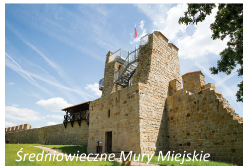
Średniowieczne Mury Miejskie