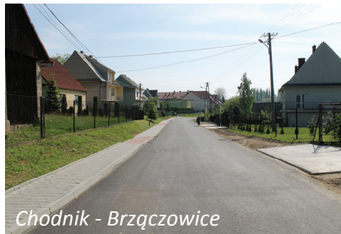
Chodnik - Brzeczowice