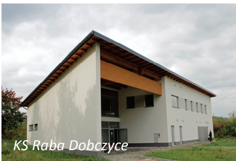
KS Raba Dobczyce