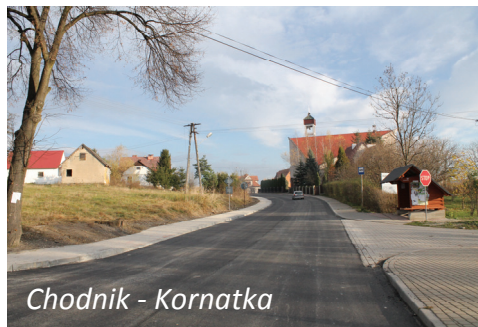
Chodnik - Kornatka