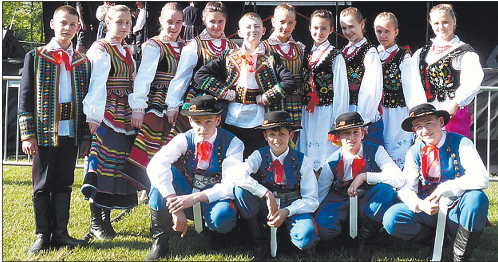
Aus der polnischen Partnerstadt Dobczyce kommen die Künstler der Folkloretanzgruppe »Zespół Piesni i Tanca« zum Versmolder Stadtfest. Zudem ist es den Organisatoren gelungen, den serbischen Musiker Branko Sanader für ein Konzert zu gewinnen.