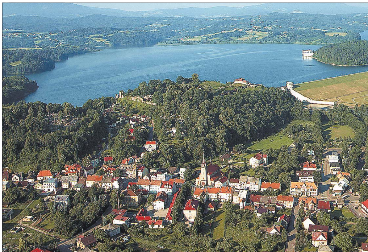
Der malerische Stausee des Flusses Raba hat als Trinkwasser-Reservoir große Bedeutung. Die Stadt setzt sich für eine Teil-Öffnung des geschützten Gewässers für Tourismus und Naherholung ein.

Im 30-jährigen Krieg schleiften die Schweden die schwer einnehmbare Trutzburg, die danach noch bis ins 19. Jahrhundert bewohnt