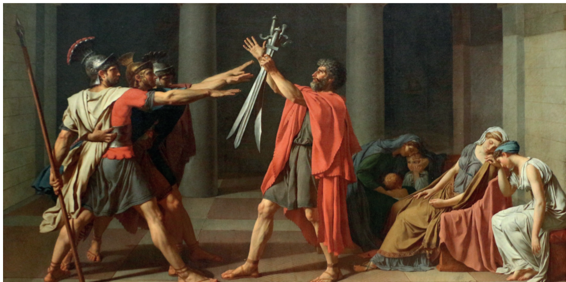
Można odejść na zawsze, by stale być blisko. ks. J. Twardowski

Najwybitniejsi przedstawiciele: Jacques-Louis Dawid, Jean Auguste Ingres