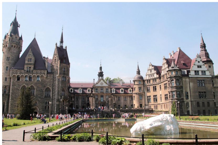
Zamek 99. wież w Mosznej w województwie opolskim, to jedno z miejsc, które warto zobaczyć