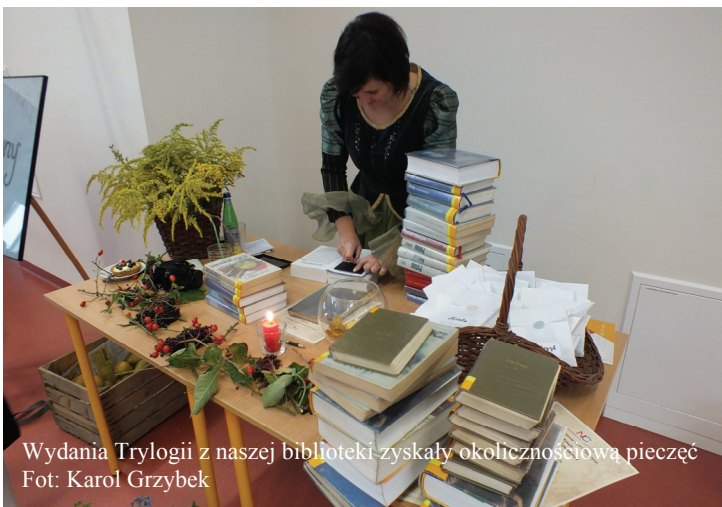
Wydania Trylogii z naszej biblioteki zyskały okolicznościową pieczęć

Zapachniało przygodą, ziołami i smakowitą kuchnią. Obecni na spotkaniu z Trylogią uczestnicy dobzczyckiej odsłony Narodowego Czytania mogli wysłuchać wybranych