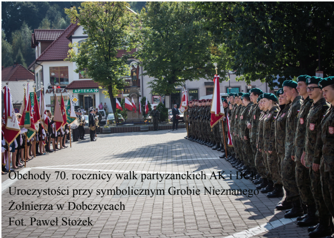
Obchody 70. rocznicy walk partyzanckich AK i B Uroczystości przy symbolicznym Grobie Nieznanego Żołnierza w Dobczycach

skiego, o pseudonimie „Prawdziec”, - siedemdziesiątą rocznicę bitwy pod Łysiną i tragicznej w skutkach pacyfikacji Wiśniowej i okolicznych miejscowości.