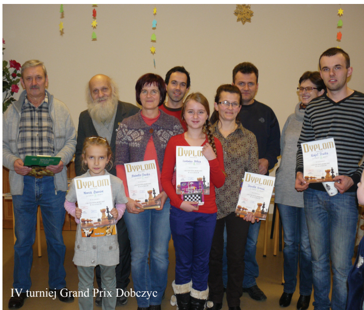
IV turniej Grand Prix Dobczyc

wało Stowarzyszenie „Więź” przy współpracy z Uczniowskim Klubem Sportowym „Elektron” przy Zespole Szkół w Dobczycach. Wszyscy uczestnicy zostali poczęstowani galaretką i cukierkami oraz wybierali upominki w kolejności zajętych miejsc