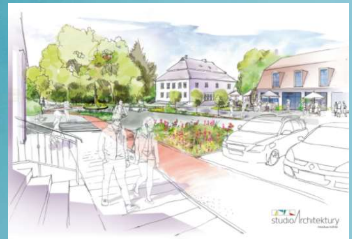
Zielony Rynek – galeria - przestrzeń wypoczynku, spotkań, handlu i usług