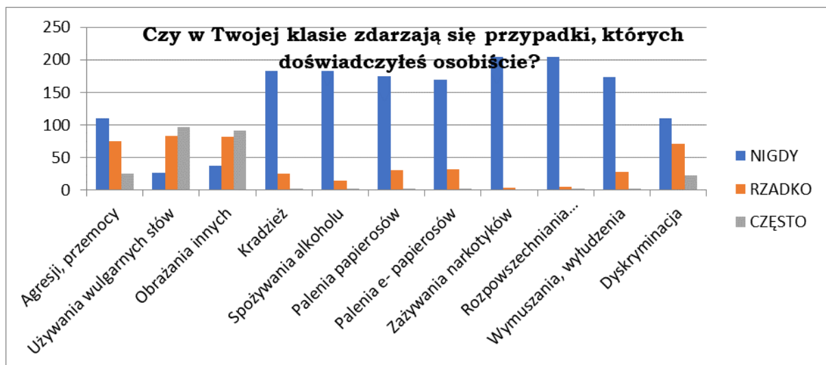
Wykres nr 3. Przypadki doświadczane przez uczniów szkół podstawowych na terenie Dobczyc.