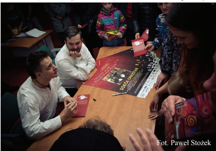
Fot. Paweł Stożek

Żywiółowy Sokół Orkestar zagrał na dobzczyckiej scenie dla publiczności, która co roku, w pierwszy weekend listopada, rezerwuje sobie czas na wizytę w tym mieście nad Rabą. Wszystko za sprawą Dobzczyckich za-